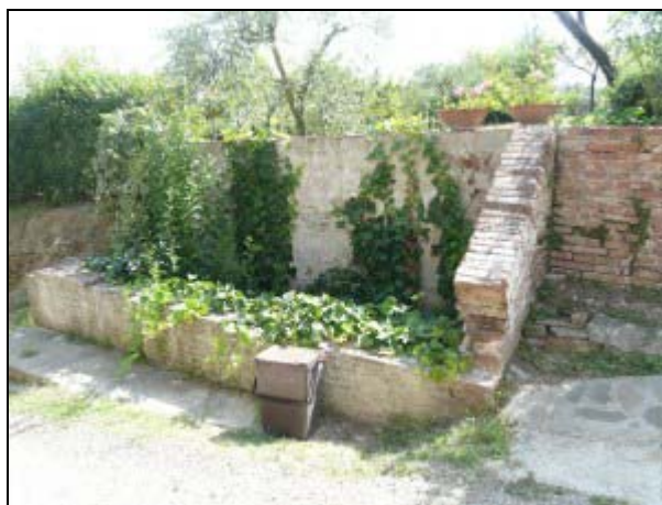
Quel che resta del pillone-lavatoio

Una mattina, mentre mia madre era intorno al fuoco a rimediare un pasto, vennero due tedeschi che, armi in pugno, ci intimarono di andarcene subito da lì. “Andare nord... andare a nord” dicevano.