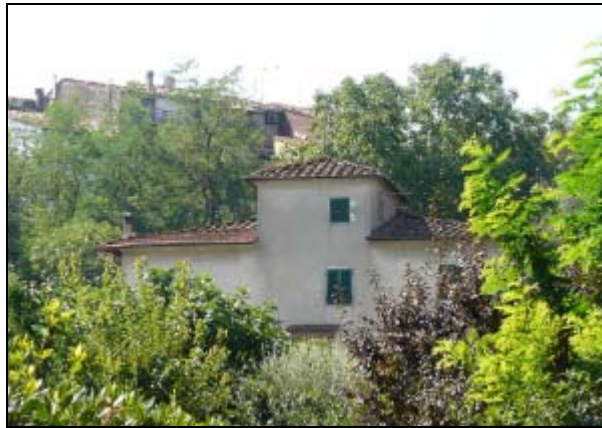
La casa della Fontina

Era morto da poco a quasi cent'anni. Ci sentivamo abbastanza al sicuro perché la casa rimaneva a nord del paese, a mezza costa della collina, e le cannonate arrivavano da sud e quindi o passavano oltre o si fermavano nelle case alte che sovrastavano la casa del nonno detta della "Fontina" perché nei pressi c'era una fontanella di acqua sorgiva limpida e fresca.