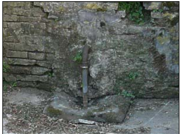
Quello che resta della Fontina – Lo zampillo è stato intubato.